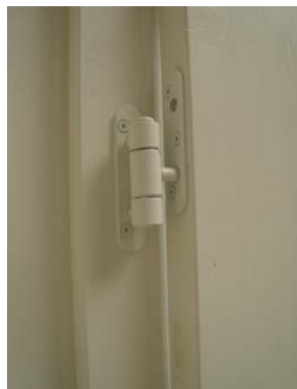
3 Stück Anuba-Bänder mit Verstärkungsplatten halten die Tür