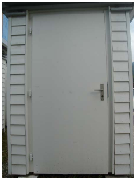
Tür nach aussen öffnend

Als Türbänder werden 3 Stück stabile Anuba-Bänder mit Verstärkungsplatten verwendet. Beim Türschloss handelt es sich um ein Kastenschloss mit Kaba-Zylinderausschnitt. Der Schliesszylinder ist im Preis nicht inbegriffen.