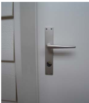
Drücker und Schilder vernickelt

Drücker und Schilder sind vernickelt. Die Türen können bei einem eventuellen Verziehen oder bei Senkungen der Fundamente nachgerichtet werden.