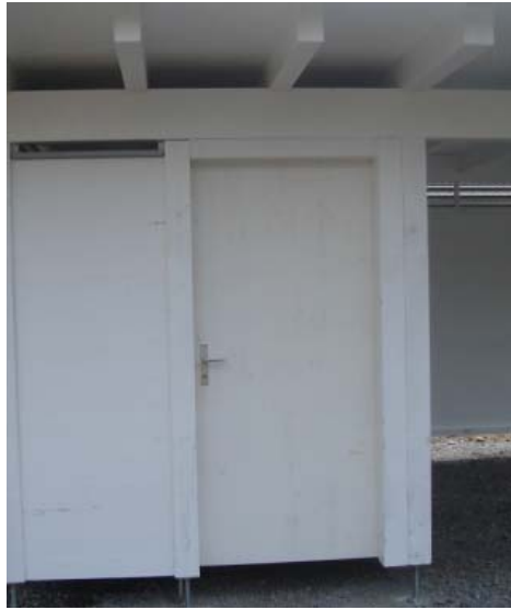
Tür bei 3-Schichtplattenwänden