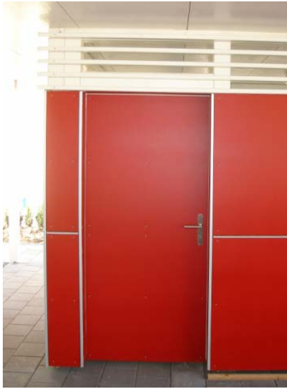
Türblatt mit Formboard belegt

Bei den Wandverkleidungsvarianten Formboard und Stahlwellband werden die Türblätter mit entsprechenden Materialien belegt.